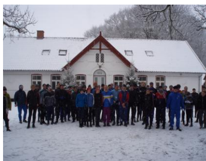
Vinterlang Feldborg 2009