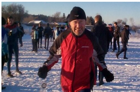
Vinterlang Silkeborg 2007